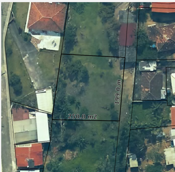
IMAGEM DO IMÓVEL